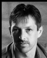
Autor Gerhard Wiesmeth

Problemhundetherapeut, Gebrauchshundeausbilder, Kynophobiotherapeut, Sachverständiger im Hundewesen, Hundewelten Ausbildungsleitung Zahlreiche Wolfsstudien